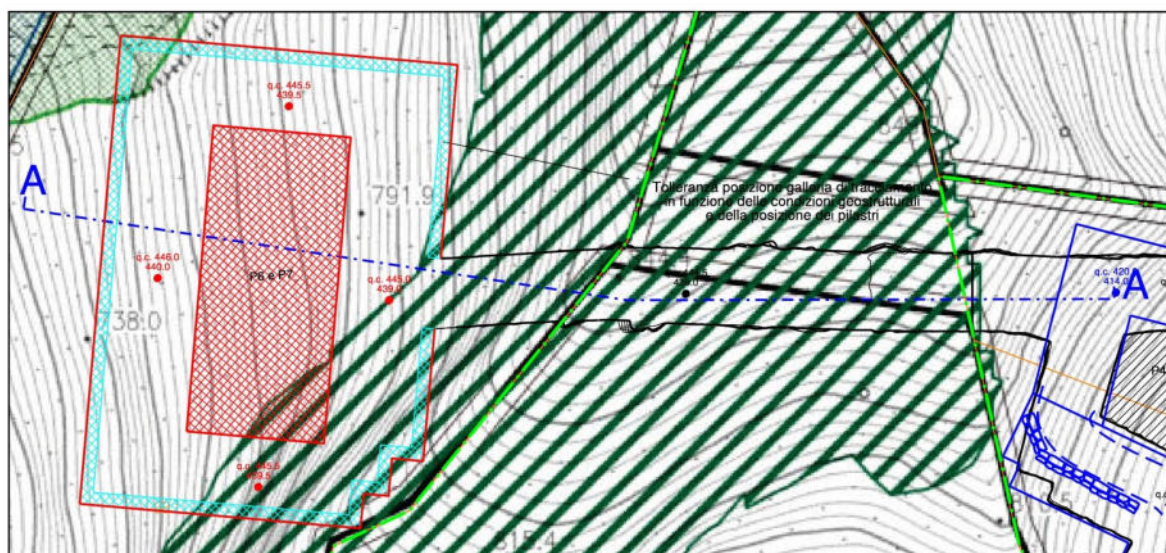
Sovrapposizione tra il progetto in esame e la tavola F1.5_ Disciplina dei suoli, delle attività estrattive e degli insediamenti” allegata al PABE.

Nell’immagine seguente si riporta la sovrapposizione tra il progetto in esame e i limiti del “Crinale e vette da tutelare” ai sensi dell’art. 8 c.7 lettera c) delle NTA del PABE. Si riporta anche la sezione A-A per evidenziare come le aree da tutelare si trovino a partire da ca. 330 m sino a ca. 400 m al di sopra del tetto del sotterraneo. L’elevata profondità del sotterraneo rispetto all’esterno consente di affermare come le escavazioni non possano avere alcun tipo di influenza rispetto al crinale stesso.